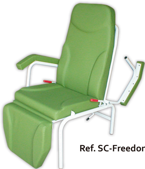
Ref. SC-Freedom / Cod. 1400