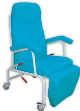
Con ruedas de 80 mm., 2 con freno. Cod. 1410 / Ref. SC-Freedom+J

Para acomodar a pacientes con enfermedad, lesión, discapacidad o deficiencia, ancianos, acompañantes y otros usuarios. Estructura de gran robustez y durabilidad en acero pintado al horno en EPOXI-POLIESTER. Respaldo abatible por cilindro de gas Reposapiernas abatible independiente por cilindro de gas. Reposabrazos abatibles, gancho para bolsa de orina. Asidero de empuje en respaldo. 2 acoples portasueros. Tapizado con resistencia a la abrasión, transpiración, saliva, sangre, orina, luz UV, aceites y manchas. Protección antimicrobiana, antibacteriana y antimicótico. Ignífugo M2 y lavable. Impermeabilidad.